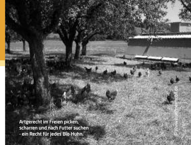
Artgerecht im Freien picken, scharren und nach Futter suchen - ein Recht für jedes Bio-Huhn.

Im Ökolandbau wird die Tierhaltung in den Betriebsablauf integriert. Die Richtlinien der Bioanbauverbände schreiben eine Bewirtschaftung des Hofes in geschlossenen Kreisläufen vor. So wird zum Beispiel ein Teil der Ernte als Tierfutter verwendet, und der Mist, Jauche und Gülle kommen als Dünger auf die Felder. Da die Zahl der Tiere im Ökolandbau durch die Fläche begrenzt wird, die zur Verfügung steht, bleibt die Auswaschung von Nitrat und Stickstoff-Emissionen begrenzt und das Grundwasser wird nicht belastet.