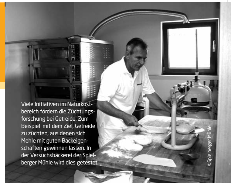
Viele Initiativen im Naturkostbereich fördern die Züchtungsforschung bei Getreide. Zum Beispiel mit dem Ziel, Getreide zu züchten, aus denen sich Mehle mit guten Backeigenschaften gewinnen lassen. In der Versuchsbäckerei der Spielberger Mühle wird dies getestet.

Beutelsbacher und Voelkel haben Spezialitäten im Angebot, die zu 100 Prozent aus samenfesten Gemüsesorten gewonnen werden. Damit leisten sie einen wichtigen Beitrag zum Erhalt und zur Verbreitung samenfester Sorten.